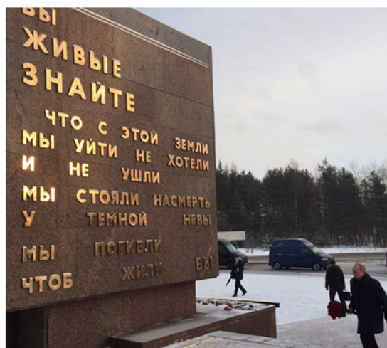
Президент Российской Федерации В.В. Путин возлагает цветы на Пискаревском мемориальном кладбище